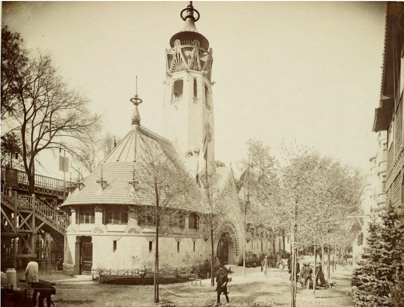
Suomen paviljonki Pariisin maailmannäyttelyssä.

Ensimmäinen maailmannäyttely järjestettiin Lontoossa kuningatar Victorian puolison, prinssi Albertin aloitteesta vuonna 1856.